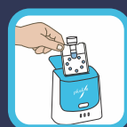
Amplificación e identificación