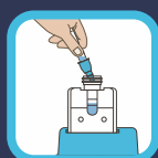
Transferencia del agente