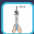
Mezcla: liberación de ácido nucleico