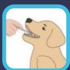
Colección de muestra